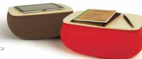
Brown CSB17BR ブラウン